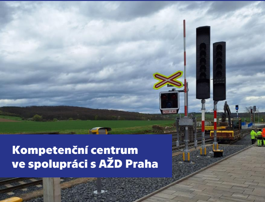
Kompetenční centrum ve spolupráci s AŽD Praha