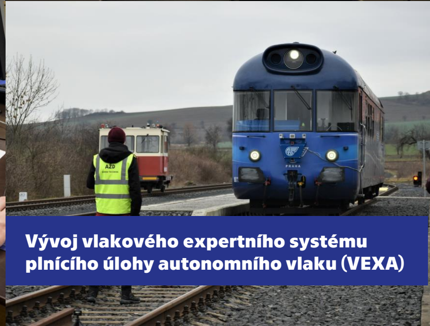
Vývoj vlakového expertního systému plnění úlohy autonomního vlaku (VEXA)