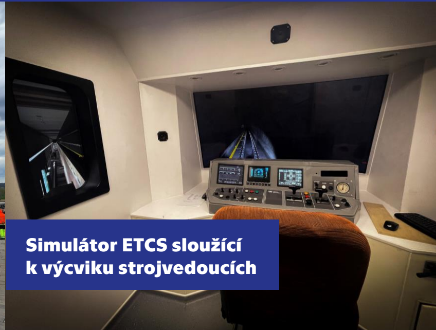
Simulátor ETCS sloužící k výcviku strojvedoucích