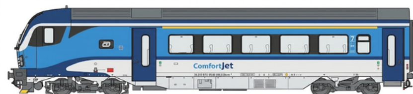
ČD ComfortJet 20x