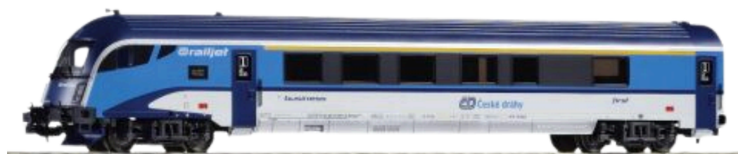
ČD railjet 7x